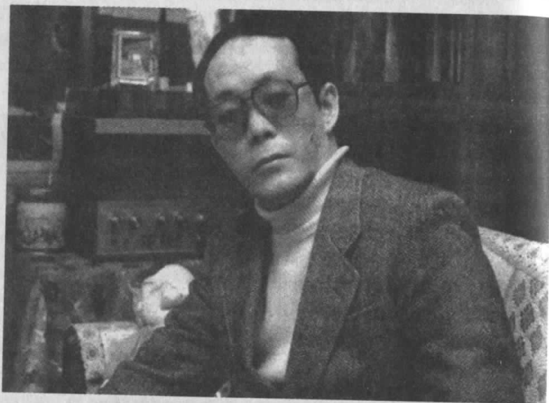
Imaginea 1: Canibalul Issei Sagawa în anul 1992. El și-a omorât prietena în Paris, în timp ce aceasta citea poezii cu glas tare, și i-a mâncat carnea, parțial crudă. După o detenție doar scurtă în Franța a fost extrădat în Japonia unde, ca urmare a influenței tatălui său, a fost pus din nou în libertate foarte curând. Printre altele, a scris articole pentru o revistă de gastronomie.

Însă pentru că între timp s-a instalat rigor mortis, sunt probleme: „Nu-i pot deschide maxilarul, însă degetele mele pătrund între dinții ei. Îi tai limba și o bag la mine în gură. Este tare: văd în oglindă cum